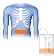
Temporäre Drainage Dauer: ca. 15 min.